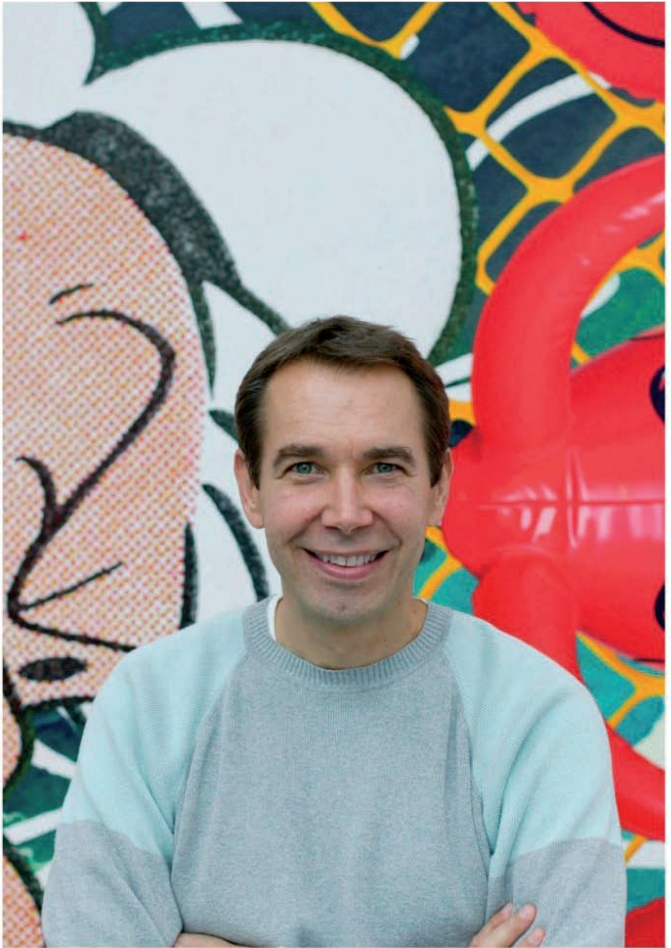
Jeff Koons 2003