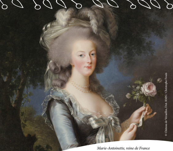
Marie-Antoinette, reine de France (1755-1793) d'Elisabeth Vigée-Lebrun, 1783