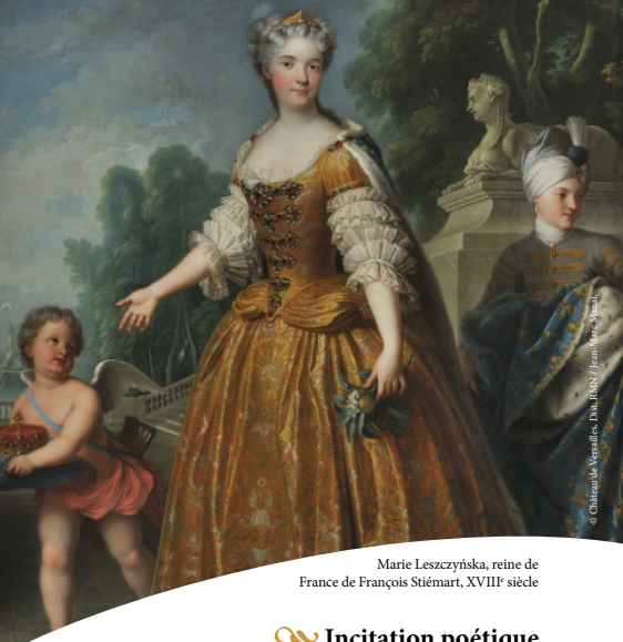
Marie Leszczyńska, reine de France de François Stiémart, XVIII e siècle