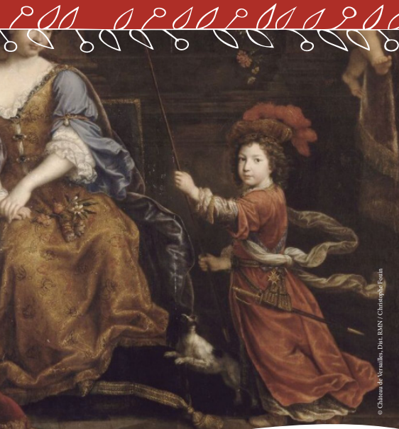
La famille du Grand Dauphin, Louis de France (1661-1711) de Pierre Mignard dit Le Romain, 1687