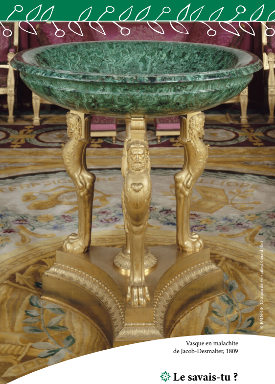
Vasque en malachite de Jacob-Desmalter, 1809

Mon nom, malachite, est le nom d'une pierre mystérieuse provenant des monts de l'Oural en Russie. Le tsar Alexandre I er de Russie offrit à Napoléon I er plusieurs objets de mon essence pour célébrer la signature du traité de Tilsit en 1807.