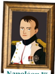
Napoléon I er