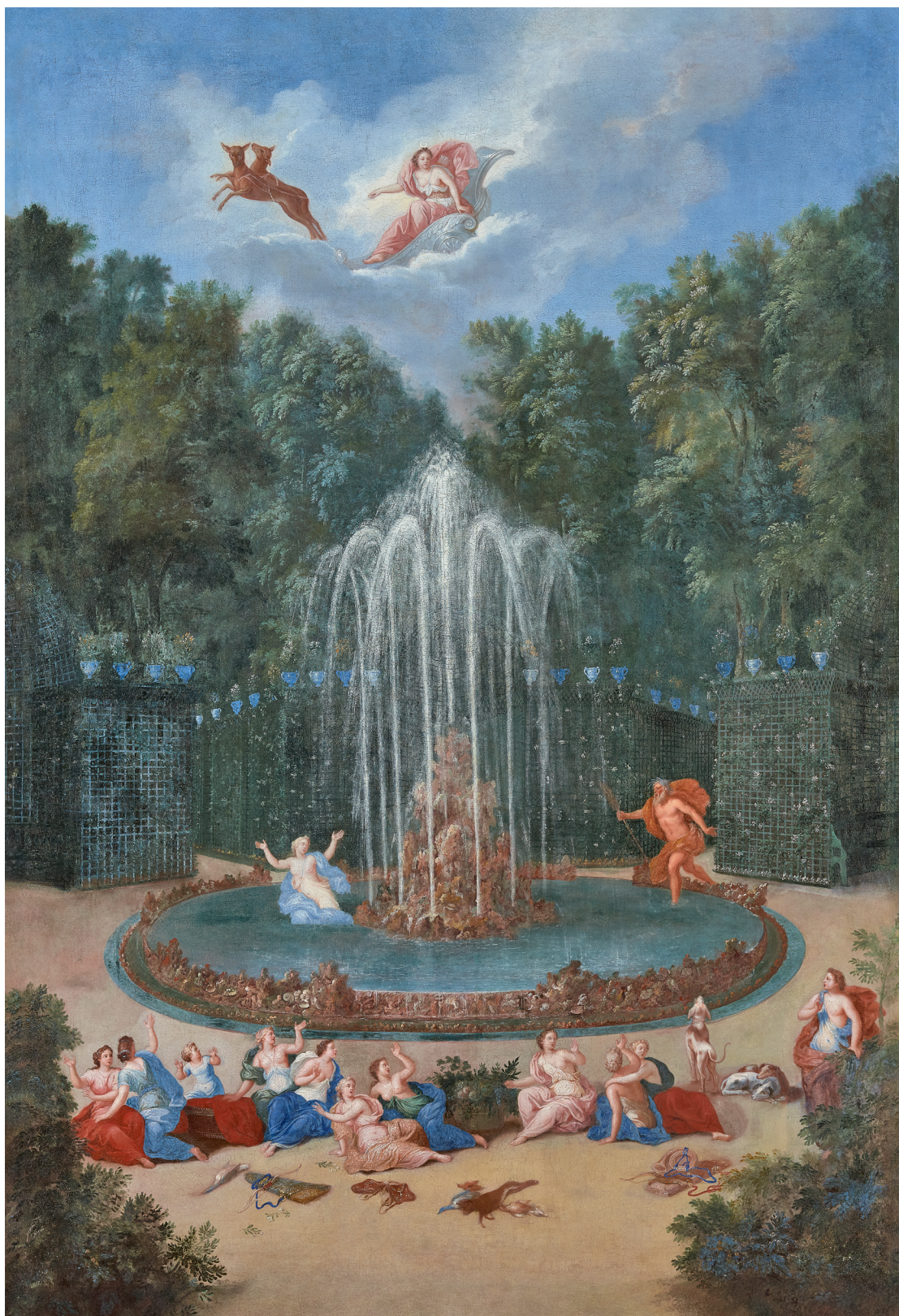
Bosquet de l'Étoile ou de La Montagne d'Eau , par Jean Cotelle. XVII e siècle. Huile sur toile. 2.000 x 1.390 m. Château de Versailles et de Trianon. MV736.