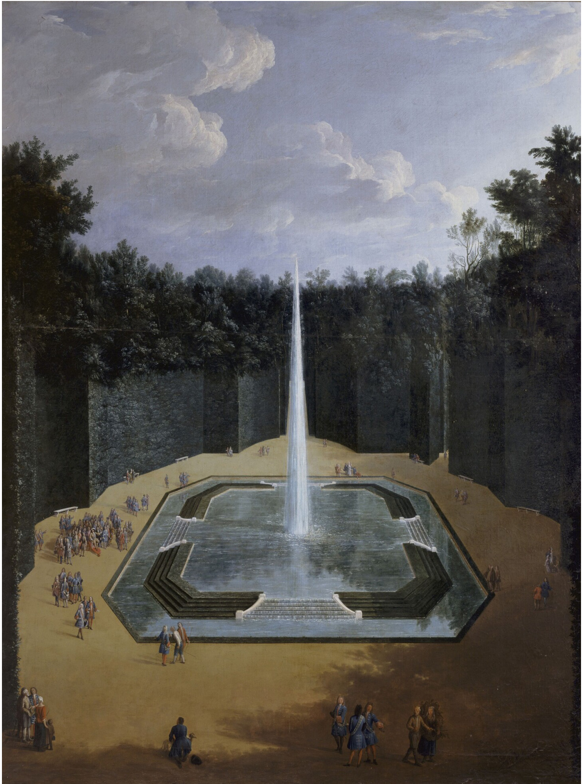
Vue du bosquet de la salle des Festins avec la fontaine de l'Obélisque dans les jardins de Versailles en 1713, par Pierre-Denis Martin. Huile sur toile. 260 x 184 cm. Château de Versailles et de Trianon. MV755.