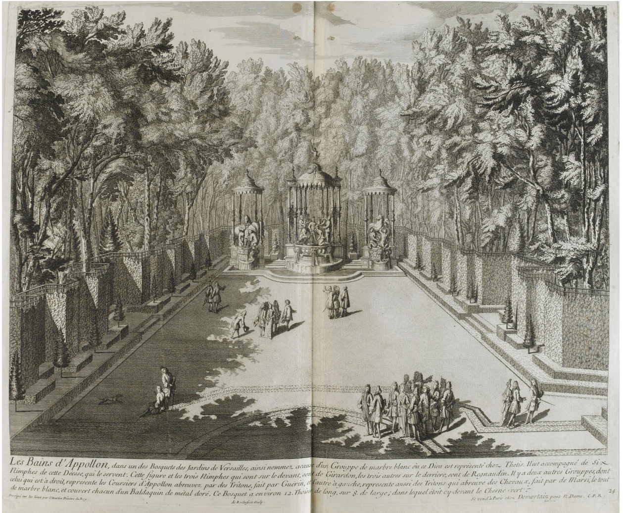
Vue perspective du bosquet des Bains d'Apollon dans les jardins de Versailles, Rochefort, Pierre (graveur) Martin, Pierre-Denis le Jeune (dessinateur), N° d'inventaire: GR 146.1.37