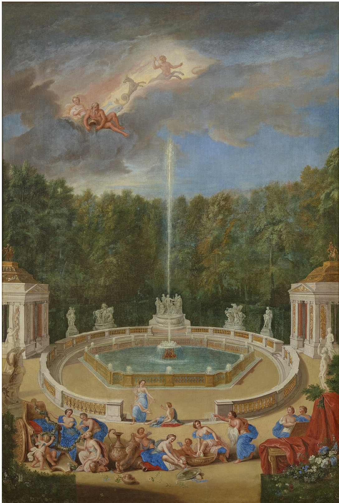
Vue du Bosquet des Dômes dans les jardins de Versailles vers 1688, par Jean Cotelle. XVII e siècle. Huile sur toile. 200 x 140 cm. Château de Versailles. MV734.