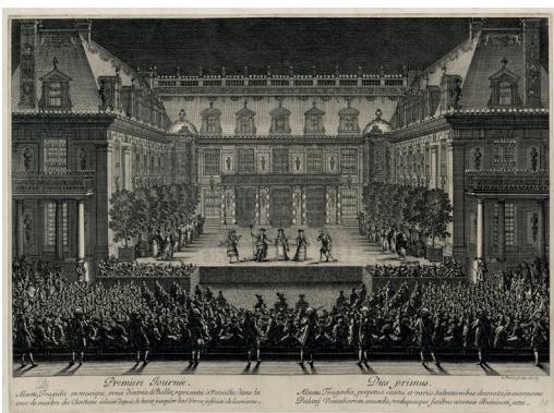
Jean Le Pautre. 1676. INV.GRAV.61. Divertissements de Versailles (1674). Première journée. Alceste, Tragédie en musique

Historien et critique d'art. Secrétaire d'ambassade à Rome auprès du marquis de Fontenay-Mareuil, il se lie avec Poussin, puis devient en 1666 historiographe du roi et de ses bâtiments, arts et manufactures de France et, en 1671, secrétaire de l'Académie d'architecture. Parallèlement à ses diverses fonctions, il donne des descriptions des fêtes royales, de Versailles et des collections de la couronne. Considéré comme un des principaux théoriciens du classicisme, Félibien est notamment l'auteur d' Entretiens sur les vies et les ouvrages des plus excellents peintres anciens et modernes (1666-1688).