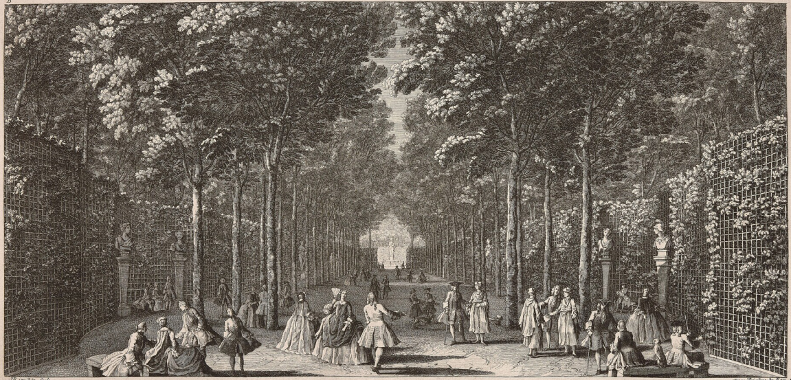
LA SALLE AUX MARRONNIERS La tranquillité et la fraîcheur dans les plus grandes chaleurs de l'été rendent ce Bosquet un des plus charmants endroits du Jardin de Versailles. Il est en fermé par un Magnifique Treillage, Orné de beaux Bustes de Porphyre, et Statues de Marbre blanc.

La salle des Marronniers dans les jardins de Versailles, par Jacques Rigaud. XVII e siècle. Gravure. Château de Versailles et de Trianon. Invgratures_grosseuvre_150_pl 38.