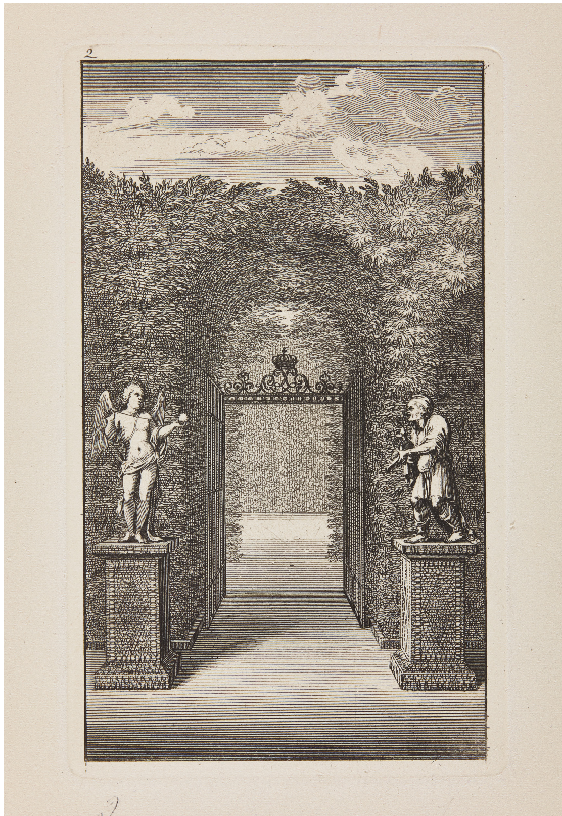
L'Amour et Esope à l'entrée du Labyrinthe de Versailles , par Sébastien Le Clerc XVII e siècle. Estampe. 22,5 x 15,5 cm. Château de Versailles et de Trianon. INV.GRAV 6783.2 INV.DESS 745