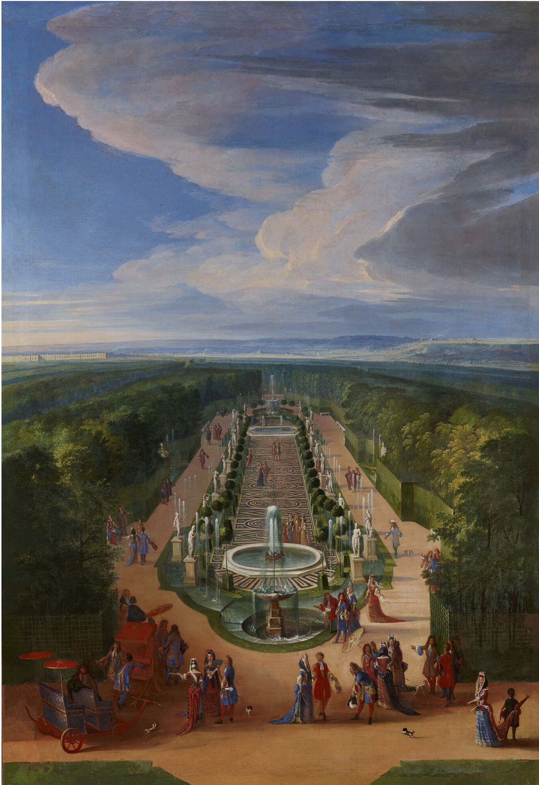
Vue du bosquet de la galerie des Antiques dans les jardins de Versailles vers 1688, par Jean-Baptiste Martin l'Aîné. Huile sur toile. 200 x 140 cm. Château de Versailles et de Trianon. MV758