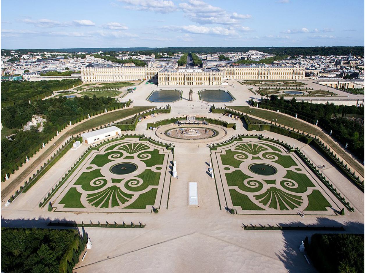
Vue aérienne du domaine de Versailles