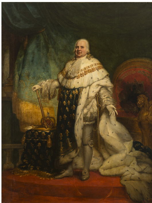
Jean-Baptiste-Paulin Guérin, Louis XVIII, roi de France, 1820. MV 4793

À la mort de Louis XVIII en 1824, son frère Charles X lui succède. Il est favorable à un retour de la monarchie absolue. Se fondant sur l'article 14 de la Charte lui conférant le droit de promulguer les ordonnances « nécessaires pour l'exécution des lois et la sûreté de l'État », il prépare et signe quatre ordonnances, par lesquelles la liberté de la presse est suspendue, la Chambre dissoute, la loi électorale modifiée, réduisant encore le nombre d'électeurs. Paris se soulève. Directement touchés, les journalistes sont les premiers à réagir.