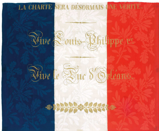
Le drapeau tricolore avait été banni pendant la Restauration. La Monarchie de Juillet entend faire œuvre de réconciliation nationale en reprenant ce drapeau, datant de la Révolution Française. Drapeau tricolore, vers 1830, damas broché, soie et or, attribué à Lemire et Cie, Lyon, musée des Tissus.