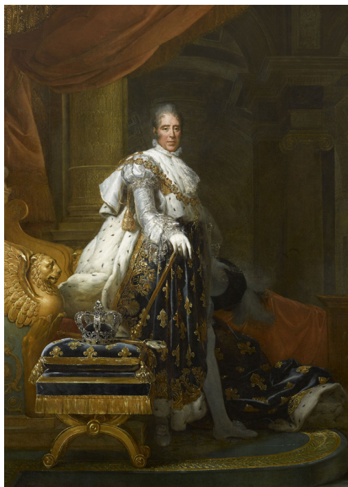
François Gérard, Charles X, roi de France, 1825. MV 4795