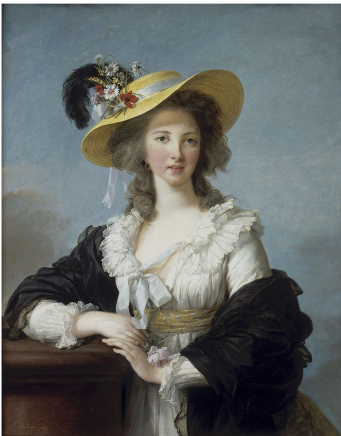
Portrait de la duchesse de Polignac, dit Portrait au chapeau de paille. Elisabeth-Louise Vigée-Le Brun, 1782. MV 8971.

L'opposition entre nature et artifice, simplicité et affectation, importante dès 1760 et plus encore après 1780, marque un infléchissement de la sensibilité à la propreté qui appartient maintenant au manuel du médecin bien plus qu'au manuel de civilité. Naturel bourgeois contre artifice aristocratique ? Une telle opposition, si elle reste simplificatrice, a pourtant bien une résonance sociale à la veille de la Révolution française.