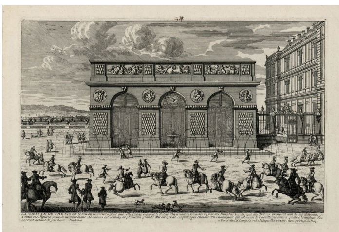
Famille des Perelle, Vue de la façade de la Grotte de Thétis au château de Versailles , XVII e siècle, estampe, Château de Versailles.

Entre 1676 et 1688, Louis XIV, voulant sans doute améliorer l'alimentation de son château en eau courante et bonne à boire sollicita l'Académie des sciences pour développer le système hydraulique. Plusieurs fontaines d'eau courante apparaissent au château, dont les plus marquantes furent celles du Grand Escalier du roi (Escalier des Ambassadeurs) et de la grotte de Thétis. Le roi pouvait désormais boire de l'eau saine qui parvenait directement dans son château. Des réservoirs d'eau saine pour un usage autre que celui de la bouche (comme ceux de Montbauron alimentés par l'eau de la machine de Marly ou encore ceux, édifiés par Gobert, qui recevaient l'eau du plateau de Saclay) furent construits pour satisfaire à une demande de plus en plus importante.