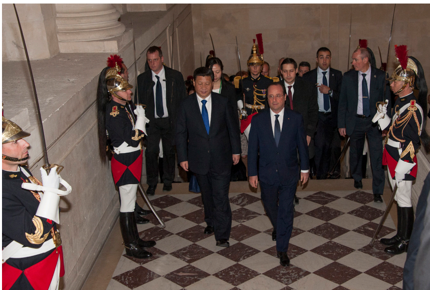
Visite d'état du Président chinois, MM. Hollande et Xi Jinping montant l'escalier Gabriel, 27 mars 2014

La III e République n'hésite pas non plus à utiliser Versailles, où elle est née, pour recevoir les chefs d'État étrangers. Le 8 juillet 1873, le Président Mac-Mahon offre un grand dîner, toujours dans la galerie des Glaces, en l'honneur du Shah de Perse. Cet événement est d'autant plus important qu'à cette époque la France souffre d'un isolement diplomatique réel, organisé par le Chancelier Bismarck au détriment de la France après la défaite de 1870. Cet isolement diplomatique est progressivement rompu au cours des années 1890 grâce aux efforts de la France pour se rapprocher de la Russie. En 1896, Félix Faure, surnommé le « Président Soleil » en raison de son goût pour le faste, reçoit en grande pompe à Versailles le tsar de Russie, Nicolas II, afin de sceller l'alliance franco-russe. À cette occasion, la galerie des Batailles est métamorphosée en un immense et impressionnant salon de réception.