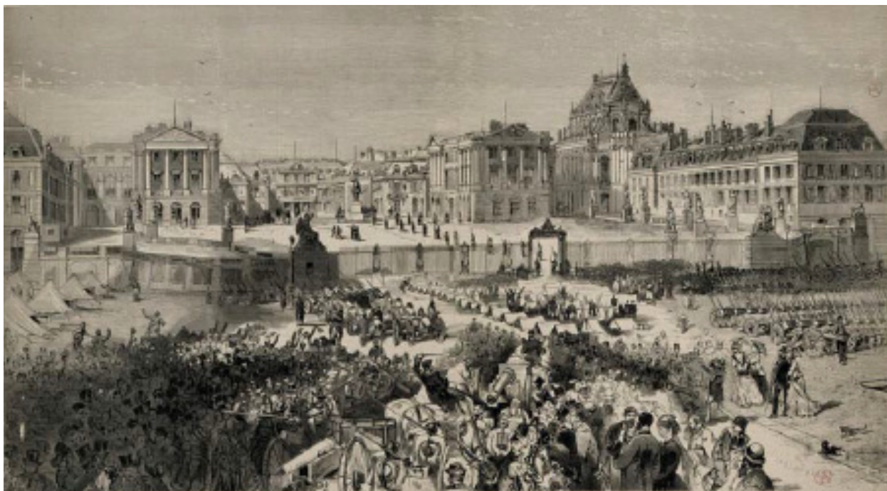
Episode de la Commune : arrivée à Versailles sur la place d'armes des pièces d'artillerie prises aux insurgés, 1871, Daudenarde, Louis-Joseph-Amédée (graveur) Urrabieta Ortiz y Vierge, Daniel dit Vierge (dessinateur) INV.GRAV 5425.

(Léonce Dupont, Souvenirs de Versailles pendant la Commune, E. Dentu, Paris, 1881, p. 85)