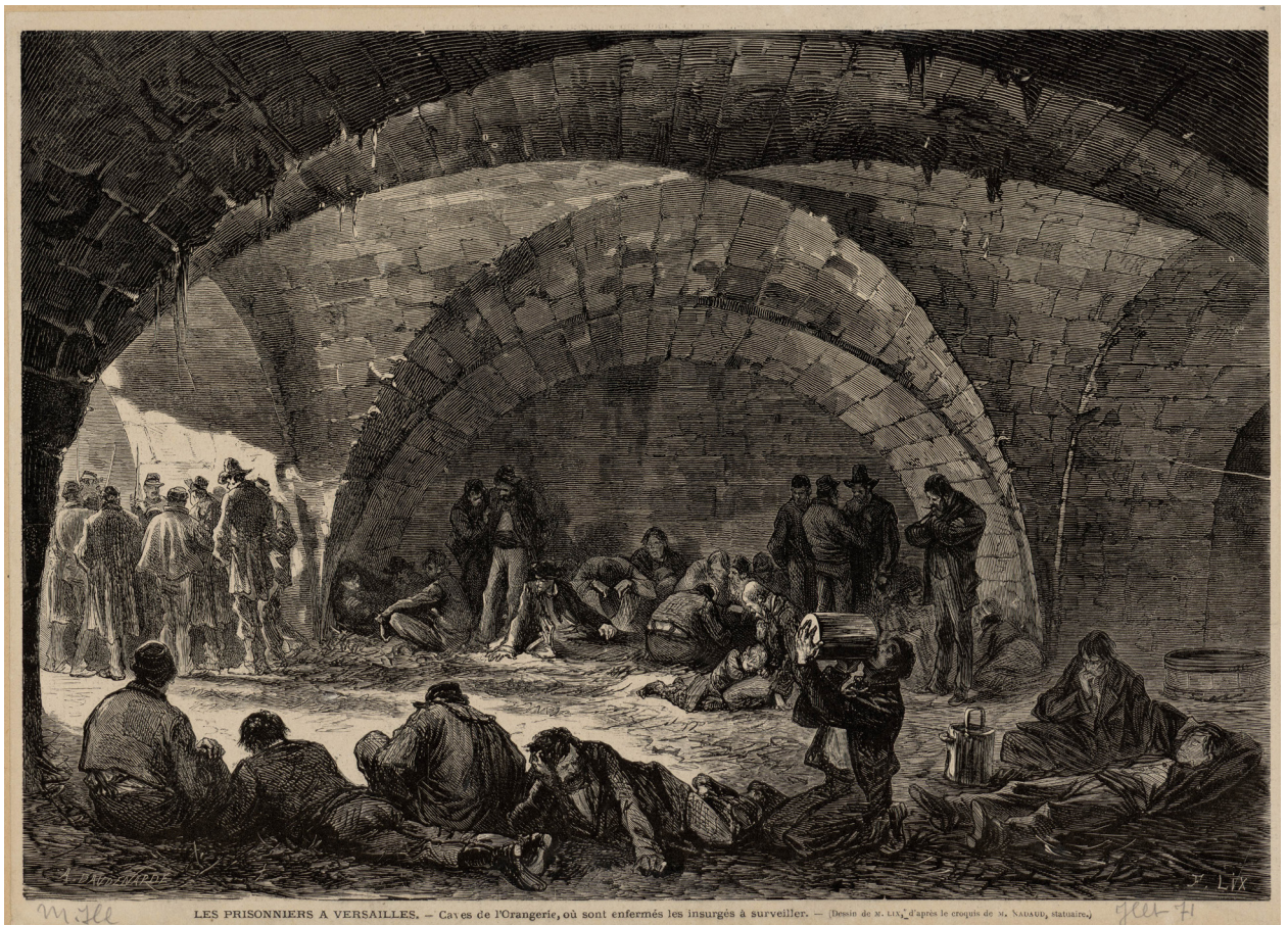
Les prisonniers de la Commune enfermés dans les caves de l'Orangerie en juillet 1871, Estampe, Tirée du « Monde illustré » G. Janet et F. Lix, juillet 1871

(Léonce Dupont, Souvenirs de Versailles pendant la Commune, E. Dentu, Paris, 1881, p. 91-106)