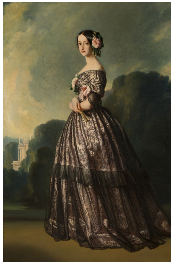
Anonyme France XIX e siècle (peintre) d'après Winterhalter, Franz-Xavier Françoise-Caroline de Bourbon-Bragance, princesse de Joinville. 1846-1847