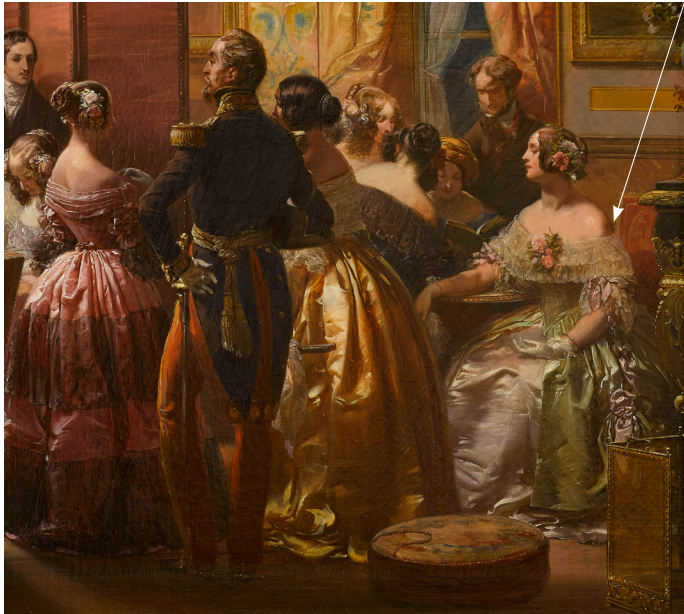
Réception en l'honneur de la reine Victoria dans le Salon des Rois au château d'Eu le 3 septembre 1843. 1845 MV 6118