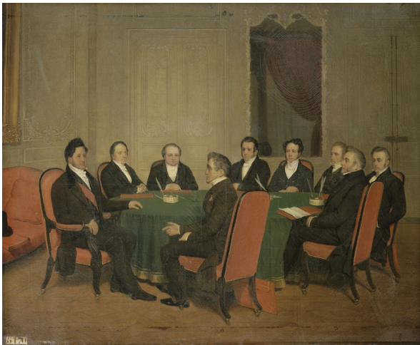
Scheffer, Henry (peintre) Conseil des ministres présidé par le roi Louis-Philippe au château de Champlâtreux, 11 août 1838. 1840. MV 5170

Le pantalon est assez collant, tendu par des bretelles et des sous-pieds en cuir.