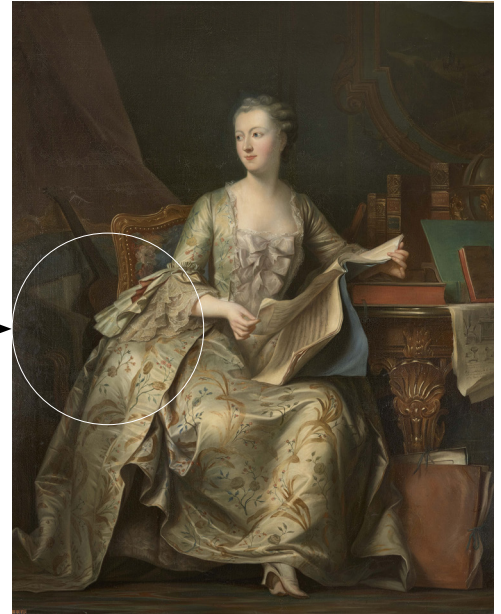
Auteur: Steuben (von), Carl (peintre) d'après La Tour (de), Maurice-Quentin (pastelliste) Jeanne Antoinette Poisson, Marquise de Pompadour. 1738-1763 MV 4446

Eugène Lami