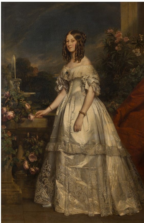
Winterhalter, Franz-Xaver Victoire-Auguste-Antoinette de Saxe-Cobourg, duchesse de Nemours. 1840