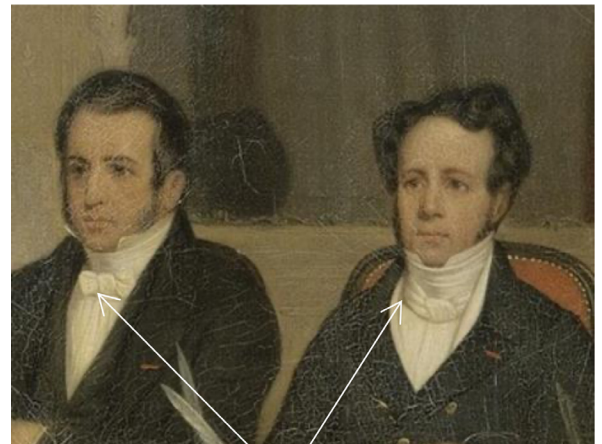
Modèles de cravates