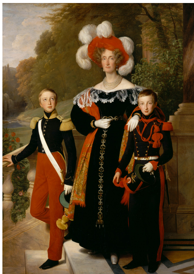
La reine Marie-Amélie, le duc d'Aumale et le duc de Montpensier. MV 5208