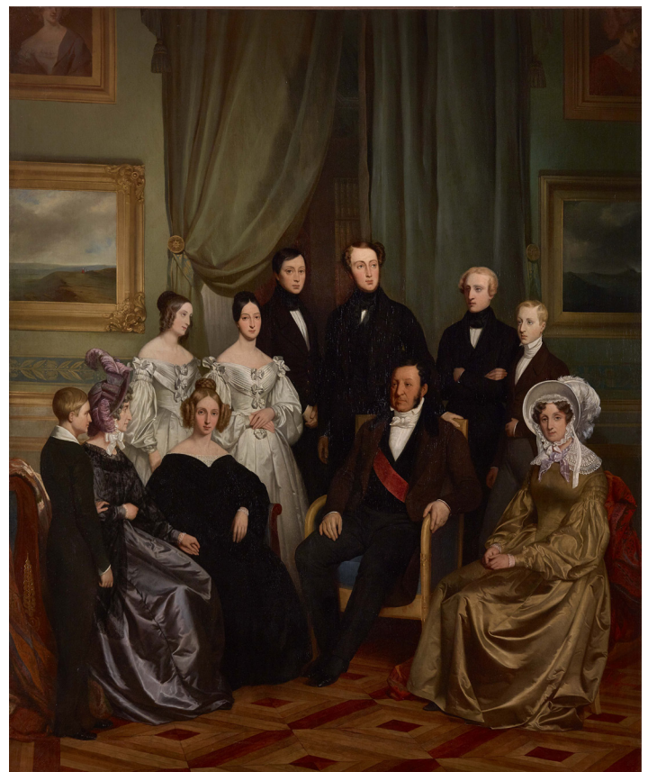
Scheffer, Henry (peintre) Louis-Philippe et sa famille. 1836-1837. V.2015.33