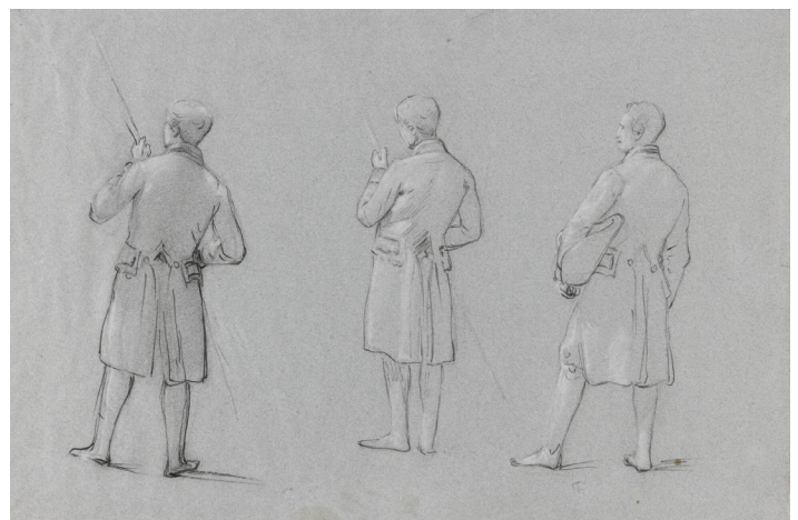
Auguste-Jean-Baptiste Étude de trois personnages pour le tableau Louis-Philippe et sa famille visitant les galeries historiques de Versailles, Vinchon. 1848. INV.DESS 649.