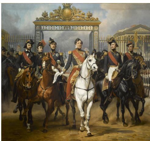
Horace Vernet Le roi Louis-Philippe entouré de ses cinq fils sortant par la grille d'honneur du château de Versailles après avoir passé une revue militaire dans les cours, 10 juin 1837. 1846 (XIX e siècle)