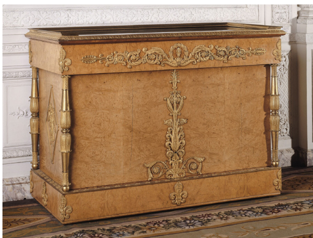
Pierre-Benoît Marcion Commode. 1813 T 44 C

Pour pallier à la forte demande que nécessitent ces aménagements, des pièces de mobilier d'époque sont achetées, mais il a fallu très vite procéder à la fabrication de copies. Parallèlement, avec le développement des expositions des Produits de l'Industrie, des pièces modernes trouvent leur place. C'est le cas de la table de famille de Georges-Alphonse Jacob-Desmalter, installée à Trianon en 1837.