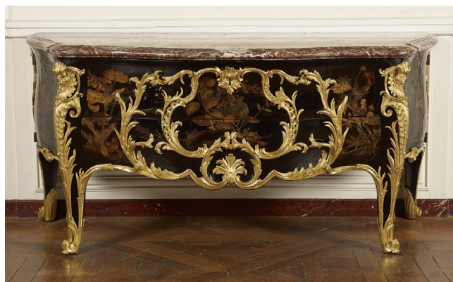
Antoine Robert Gaudreos Commode de Choisy. 1744 V.2014.1