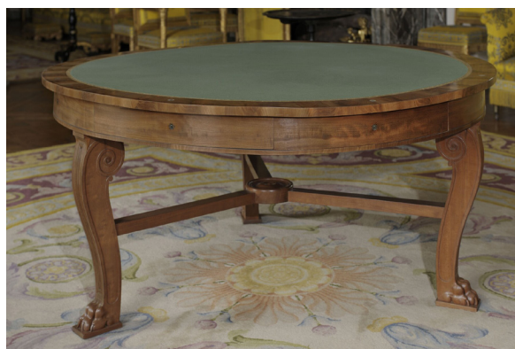
Georges-Alphonse Jacob-Desmalter Table de famille. 1837 T 82 C.1