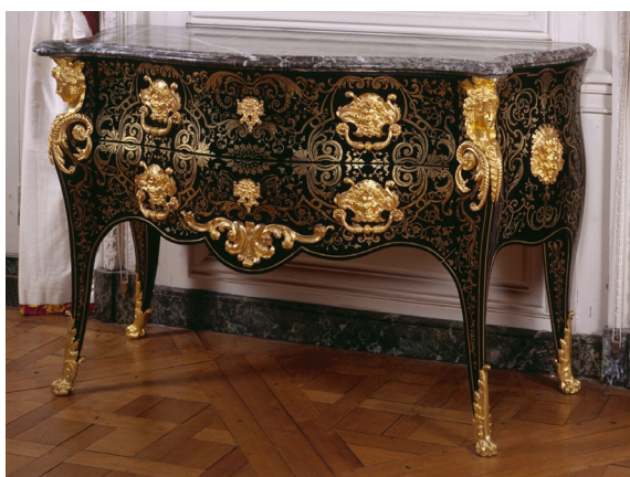
Charles Adolphe Alphonse Commode. 1846 T 433 C.2

Ainsi la banquette proposée en référence reprend-elle le code formel de la période médiévale et appartient à un ensemble qui favorise l'immersion du visiteur.