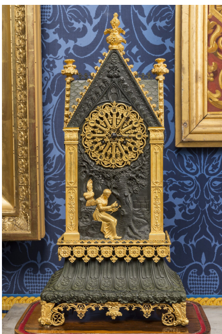
Anonyme Pendule : Brigitte effeuillant une marguerite. Chopin, J. (marchand). Paris XIX e siècle vers 1830. T 470.

Le gothique, la renaissance et, vers la fin de la Monarchie de Juillet, le style Louis XV. Quant au style Empire, le mobilier est déplacé et installé dans de nouveaux espaces.