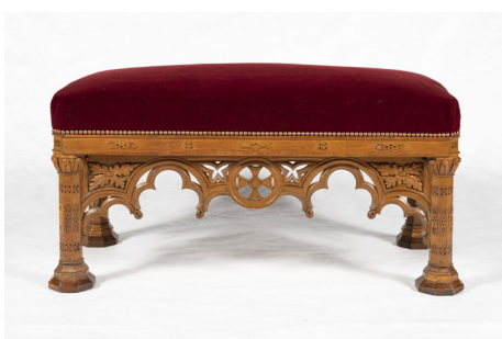
Charles Munier, tapissier Banquette. 1840 VMB 131.V.