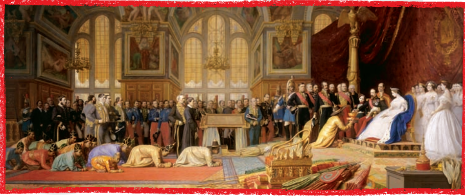
Ci-dessus les ambassadeurs du royaume de Siam sont reçus à Fontainebleau par Napoléon III et l'Impératrice Eugénie en 1861.

Ce qui différencie un trône d'un simple siège, ce n'est pas la richesse ou la beauté de ses décorations, mais la présence d'éléments indispensables tout autour. Ces attributs peuvent changer de forme selon les époques et les pays, mais ils sont toujours présents comme autant d'indices pour montrer qu'il s'agit bien là de la place du souverain.