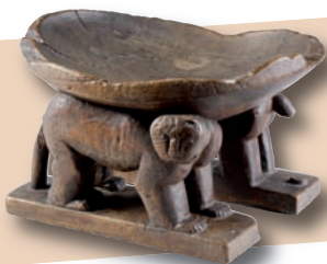
★ TRÔNE DE GHÉZO Royaume du Dahomey, XIX e s.